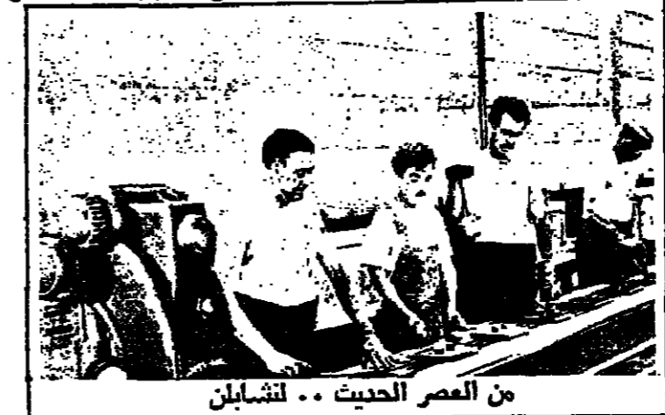
من العصر الحديث .. لتشابان

روايات هامة من روايات الخيال العلمي التي كتبها كتاب شهيرين من امثال جول فيرون مثل « ٢٠ الف فرسخ تحت الماء » او « ٢٠ الف فرسخ تحت الارض » او